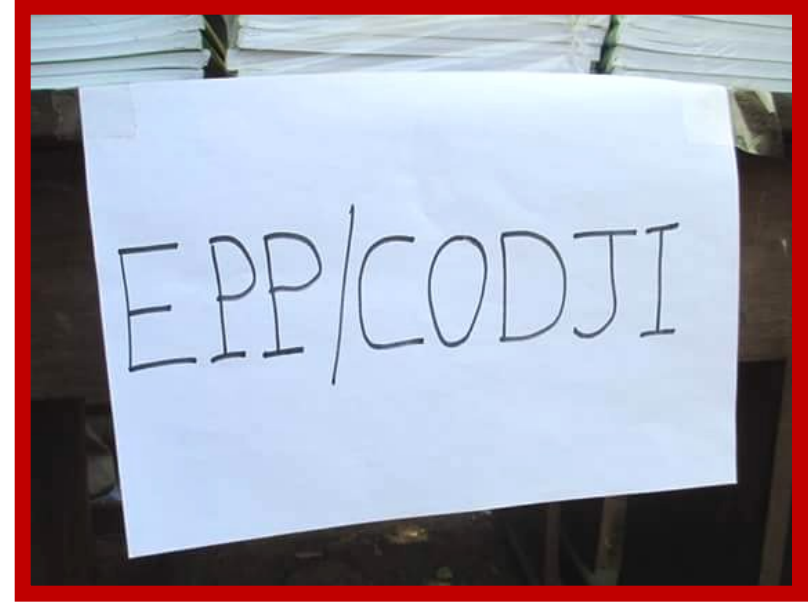
Les élèves de l'Ecole Primaire Publique de Codji.